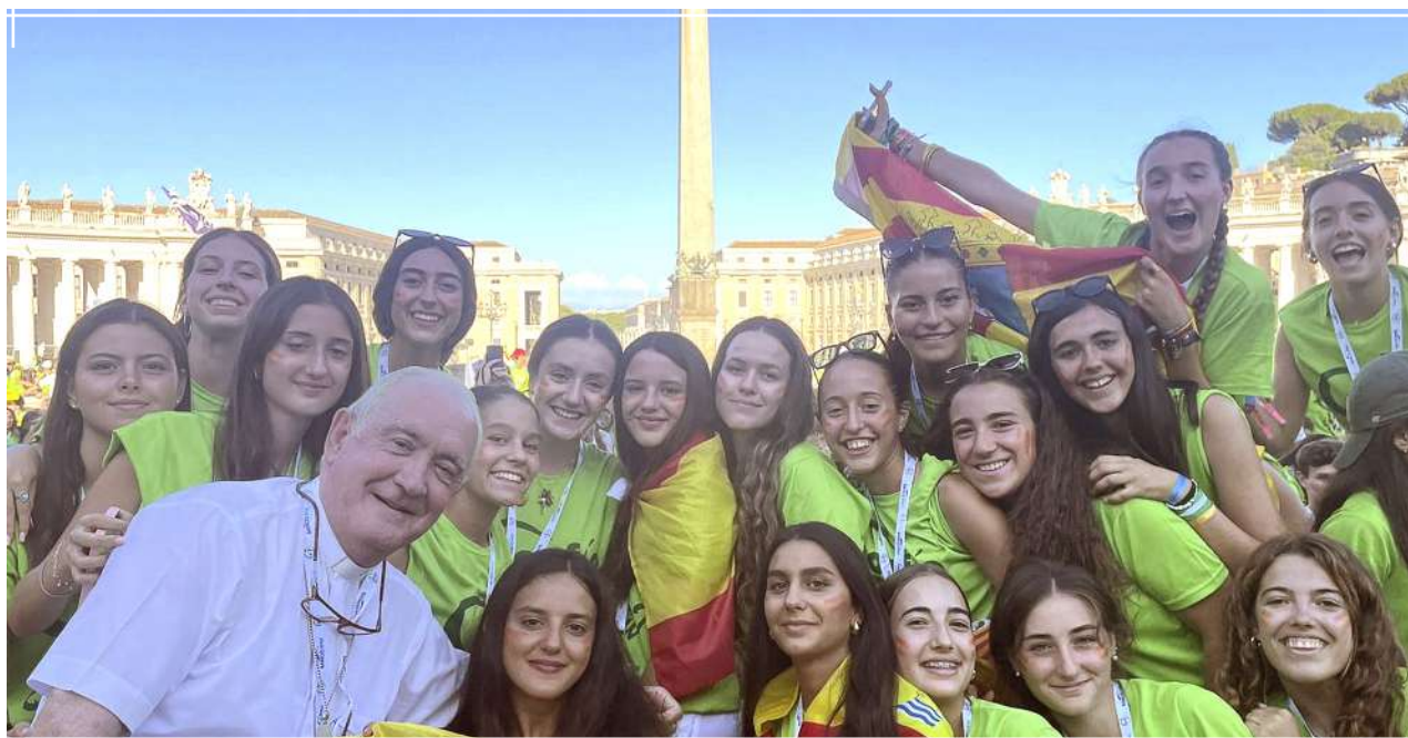
Jóvenes con nuestro Obispo en la plaza de San Pedro | Jubileo de los jóvenes en Roma, julio-agosto 2025