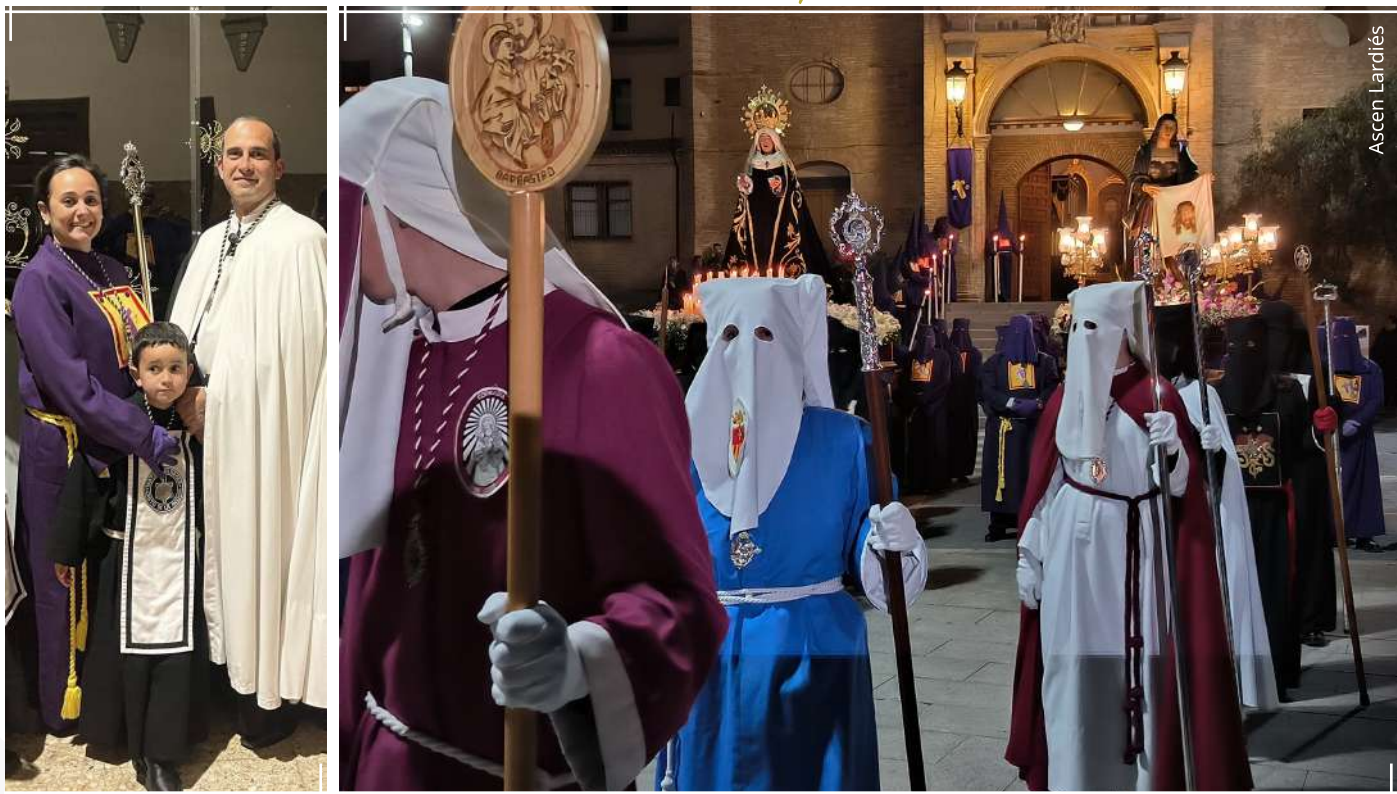
Representantes de las Cofradías en la procesión del Santo Encuentro 2025

H oy vuelvo a caminar en silencio, con el corazón sereno y la túnica cargada de recuerdos y de anhelos... Fue el año pasado cuando decidí dar el paso de salir como representante en la procesión de los Siete Dolores, un gesto nacido del cariño hacia mi Cofradía y del deseo sincero de acompañar a otros hermanos en su camino de fe. Sin embargo, aquel día quedó marcado por la tristeza compartida: la amenaza de lluvia obligó a cancelar la procesión, dejando en el aire un deseo que llevaba tiempo esperando.