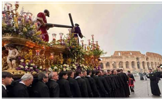
El Nazareno de León | Jubileo de las Cofradías en Roma

En Roma se cerraron las puertas jubilares y en nuestra diócesis también han finalizado los actos programados. Para nosotros, cofrades, no puede ser una fecha de la que se pasa hoja en el calendario, sino una gracia que se agradece y que se quiere seguir cultivando. La esperanza se vive, se ejercita y se transmite.